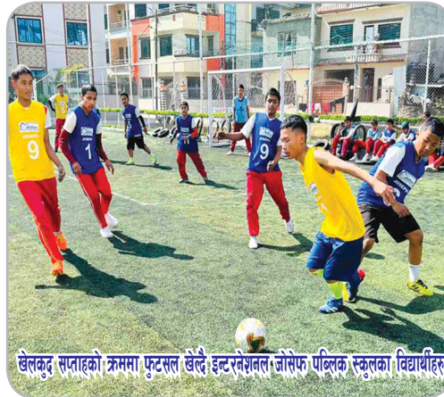
खेलकूद सप्ताहको क्रममा फुटबल खेल्दै इन्टरनेशनल जोसेफ पब्लिक स्कूलका विद्यार्थीहरू