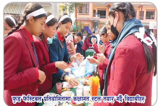
फुड फेस्टिबल प्रतियोगितामा कक्षागत स्टल तयार गर्दै विद्यार्थीहरू