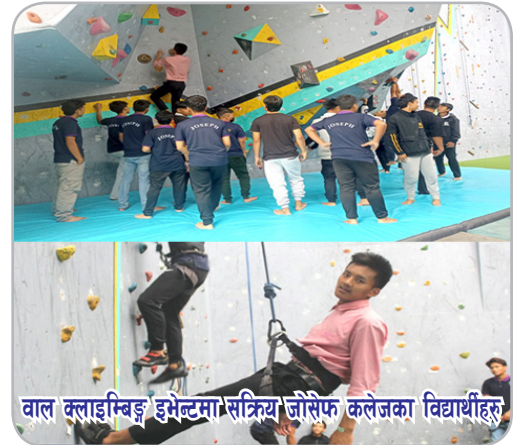
वाल क्लाइम्बिङ इभेन्टमा सक्रिय जोसेफ कलेजका विद्यार्थीहरू