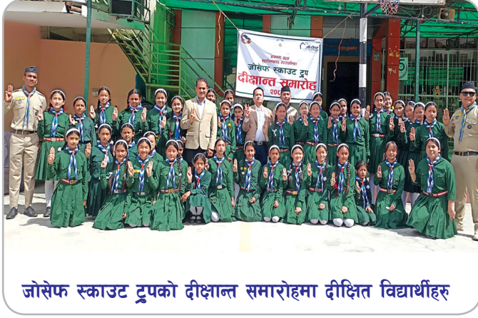
जोसेफ स्काउट ट्रूपको दीक्षान्त समारोहमा दीक्षित विद्यार्थीहरू