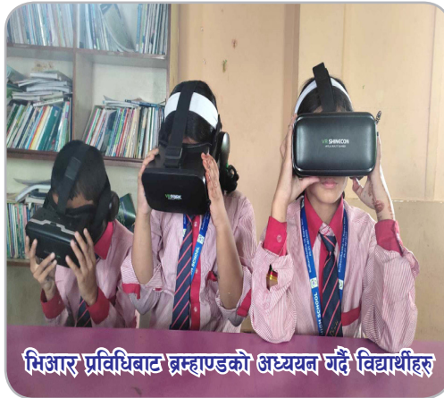
भिआर प्रविधिबाट ब्रह्माण्डको अध्ययन गर्दै विद्यार्थीहरू