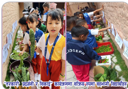
'तरकारी' प्रदर्शनी र 'सिकाई' कार्यक्रममा सक्रिय रूपमा सहभागी विद्यार्थीहरू