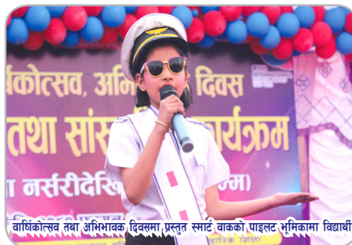
वार्षिकोत्सव तथा अभिभावक दिवसमा प्रस्तुत स्मार्ट वाकको पाइलट भूमिकामा विद्यार्थी