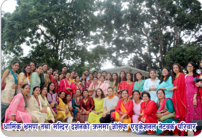
धार्मिक भ्रमण तथा मन्दिर दर्शनको क्रममा जोसेफ एडुकेशनल नेटवर्क परिवार