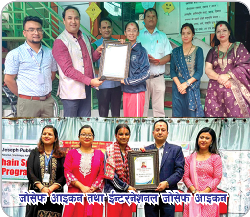
जोसेफ आइकन तथा इन्टरनेशनल जोसेफ आइकन