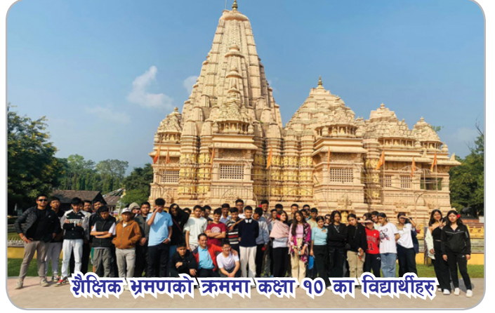
शैक्षिक भ्रमणको क्रममा कक्षा १० का विद्यार्थीहरू